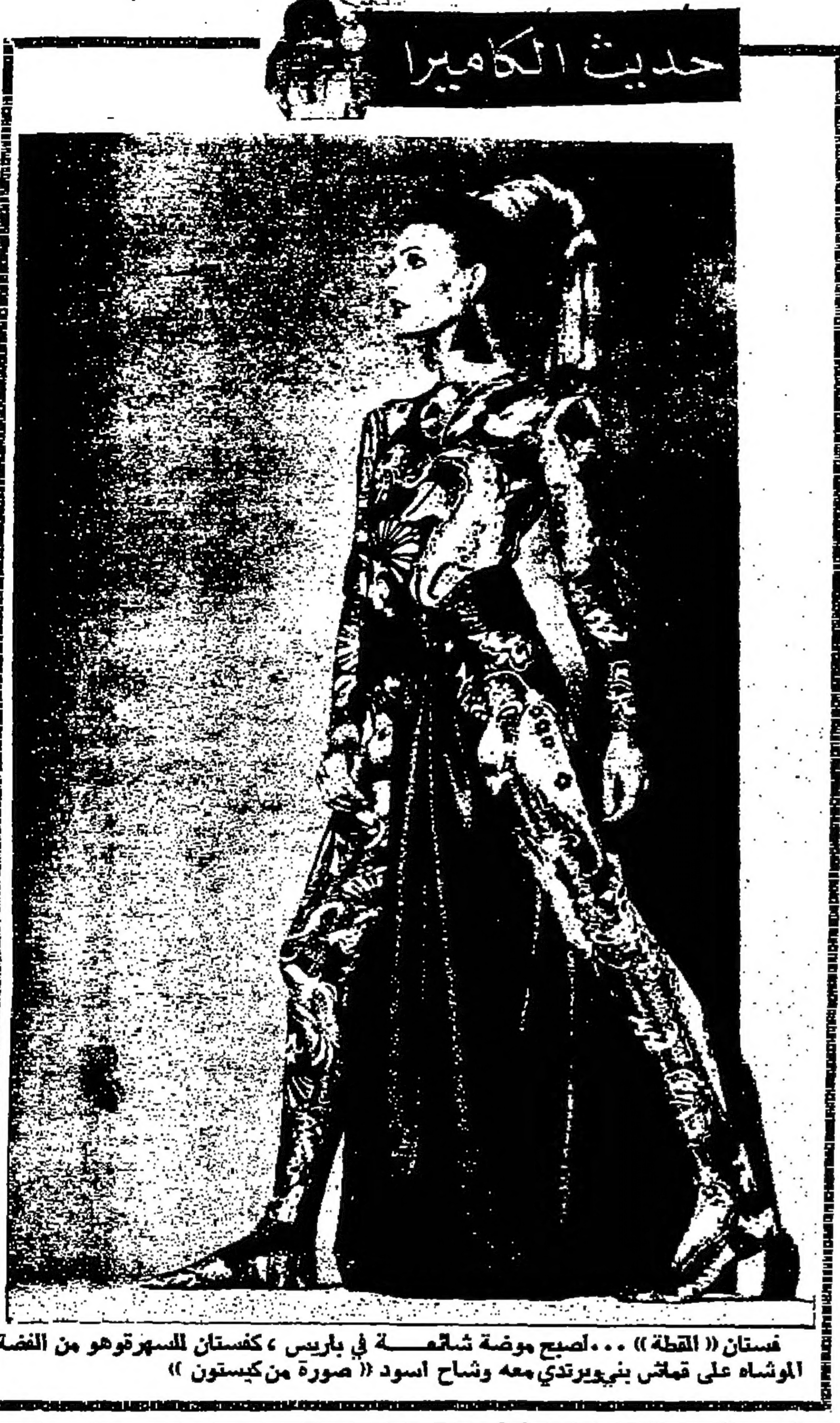
فستان «القطعة»... أصبح موضة شائعة في باريس، كاستان للسهر وهو من الفضة الموشاه على قماش نيفيرديتي معه وشاح اسود

وزير الاقتصاد يعود اليوم من واشنطن شأن - من المقرر أن يعود وزير شؤون اليوم السيد حاتم الزعبي وزير الاقتصاد الوطني بعد أن اشترك في اجتماعات البنك الدولي التي عقدت في واشنطن مؤخرا - زوجة الرائد مشيرا تسهر بالقبطة والزهو عويشي - تكلمت عن اجتماعات زوجة الرائد مشيرا زوجها وهو يبر لليرة الثالثة في مركبة الفضائية تسهر بالقبطة والزهو وقالت - أنني سعيدة لأن هذه المرة يوم هيازوي ست هذه الرحلة ليسح الجبال أمام الشباب الصامدين - تطمط طائرة تنسيكية تحمل ٣٥ راكبا براغ - اوردت وكالة الأنباء المتكبة أن طائرة ركاب تنسيكية قد تحطت يوم امس وعلى متنها ٣٥ راكبا بعد اقلاعها من مطار براغ - التي تسهر بالقبطة والزهو وقالت - أنني سعيدة لأن هذه المرة يوم هيازوي ست هذه الرحلة ليسح الجبال أمام الشباب الصامدين -